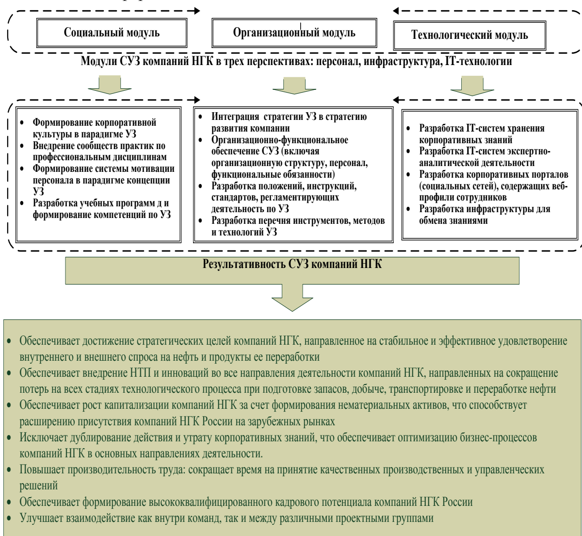
Рис.1. Функциональное назначение СУЗ компаний НГК России