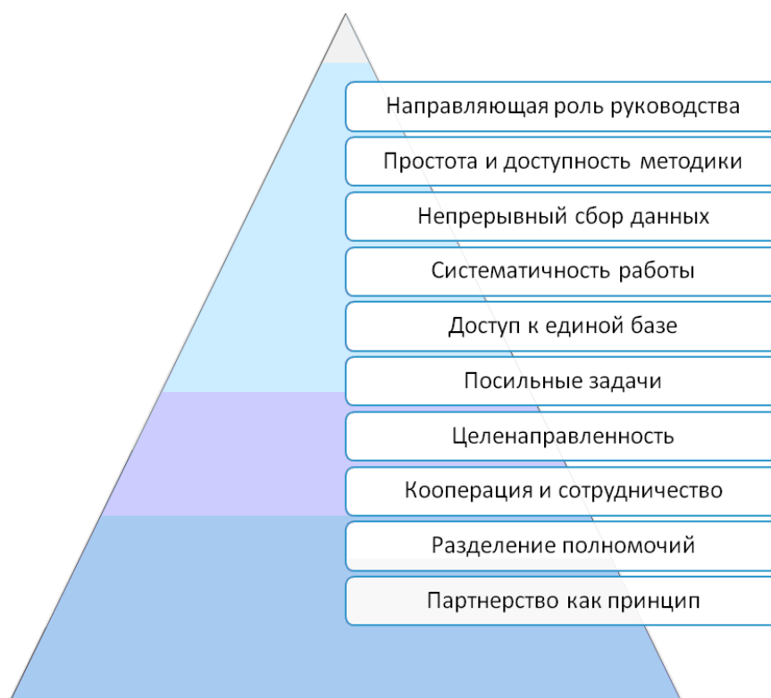
Рис.2. Факторы успеха службы экономической безопасности

К факторам успеха службы экономической безопасности можно отнести следующие (рис. 2.). [4]: