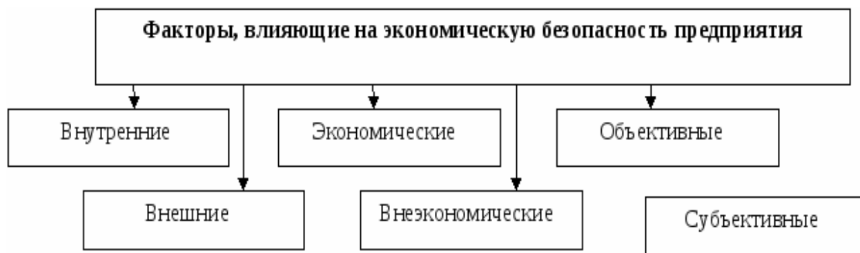
Рис. 1. Факторы, влияющие на экономическую безопасность предприятия

К факторам успеха службы экономической безопасности можно отнести следующие (рис. 2.). [4]: