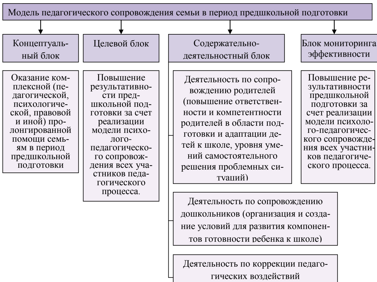
Рис. 1. Модель педагогического сопровождения семьи в период дошкольной подготовки

Педагогическое сопровождение – это системно-организованная деятельность, создающая условия для успешного обучения и развития ребенка в школе. Педагогическое сопровождение семьи в период дошкольной подготовки подразумевает системно-организованную деятельность, направленную на создание условий для благоприятного протекания процесса адаптации ребенка к школе, дальнейшего успешного обучения и развития, а также повышение уровня грамотности родителей в вопросе формирования и совершенствования готовности детей к школе. Принимая во внимание вышеизложенное, мы определили, что работа педагога с семьей представляет собой определенную модель. С нашей точки зрения она выглядит следующим образом: