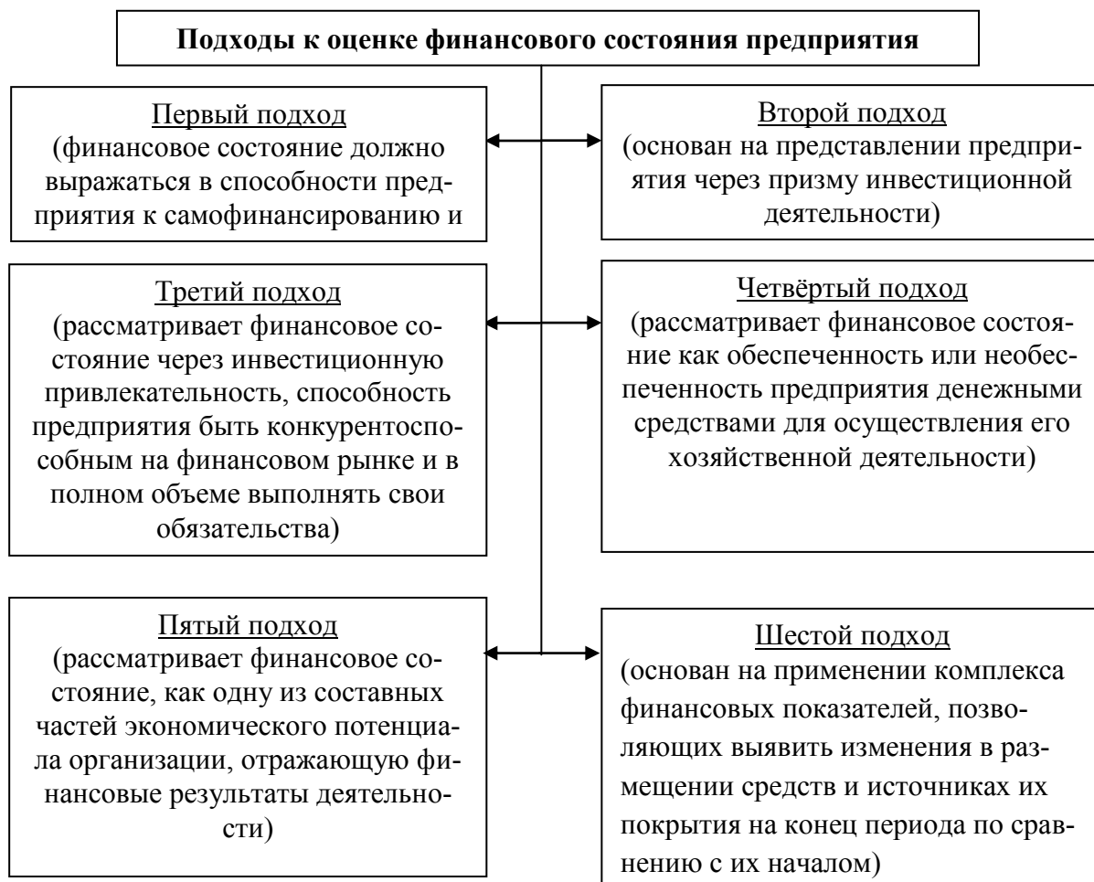
Рис. 1. Подходы к оценке финансового состояния предприятия

сколько в другую плоскость: используются такие характеристика, как состав и размещение средств, структура источников средств, оборачиваемость капитала, платежеспособность и т.д.