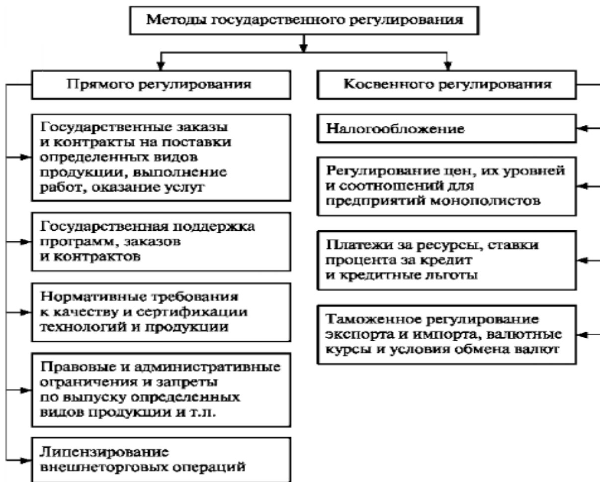
Рис. 1 – Методы государственного регулирования экономики

Для реализации целей своей экономической политики государство использует различные формы и методы, которые в совокупности образуют инструментарий государственного регулирования бизнеса. На рисунке 1 представлены методы государственного регулирования экономики.