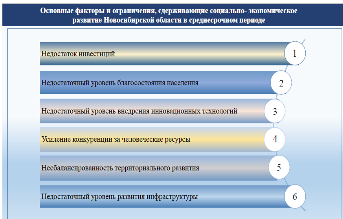
Рис. 1. Основные факторы и ограничения социально-экономического развития Новосибирской области

Значимость инвестиций подчеркнута в прогнозе социально-экономического развития Новосибирской области на 2019 год и плановый период 2020 и 2021 годов [1]. В данном документе, составленном Минэкономразвития Новосибирской области (НСО), первым из основных факторов и ограничений, сдерживающих социально-экономическое развитие региона в среднесрочном периоде назван недостаток инвестиций (рис. 1).