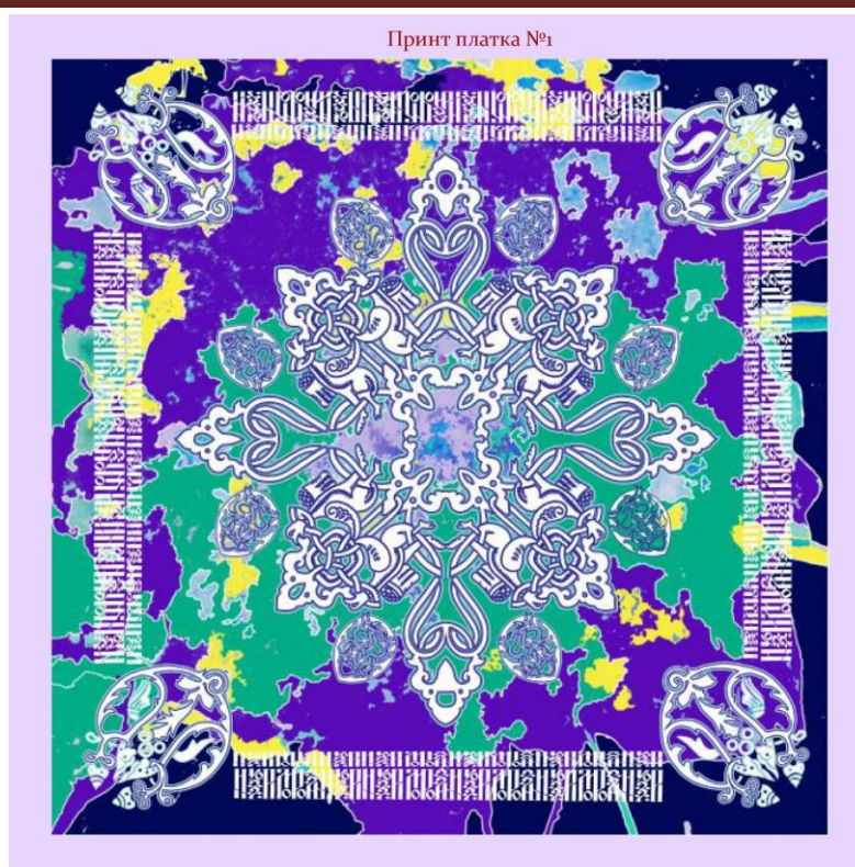
Рис.2. Пример разработанного принта для платка