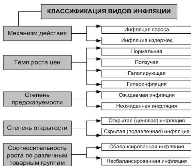
Рисунок 1 - Классификация видов инфляции

В ходе исследования была собрана годовая статистика по месяцам уровней инфляции в России в период с 2010 по 2020 год на основе данных Росстата [10]. Данные представлены в таблице 1. Уровень инфляции меняется скачкообразно и неравномерно на протяжении последнего десятилетия. Наибольший прирост значения уровня инфляции наблюдался в 2014 и 2015 годах. Экономика России в этот временной период претерпевала стадию кризиса. В отдельные месяцы в 2011, 2017, 2019 и 2020 годах можно заметить явление