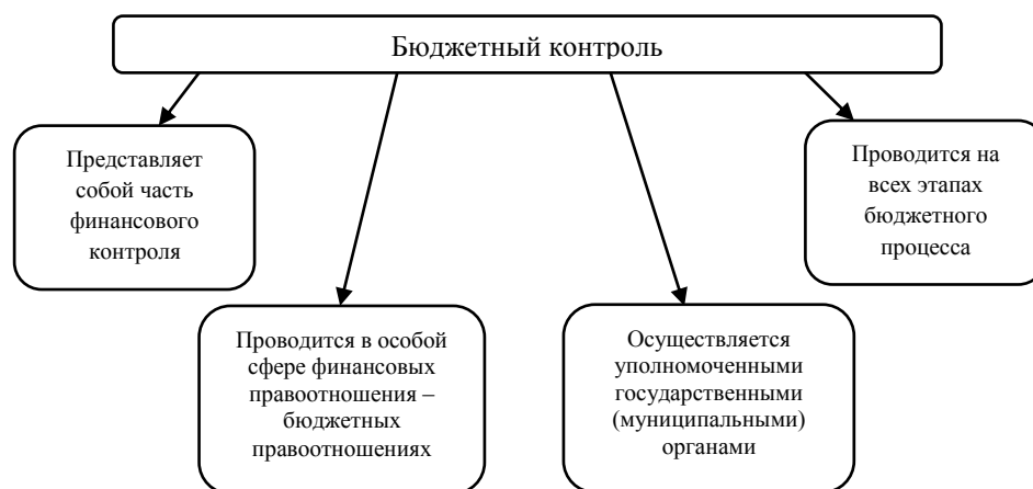
Рисунок 1 – Сущность понятия «бюджетный контроль»

Таким образом, существуют различные трактовки понятия «бюджетный контроль», но все они содержат общие черты рассматриваемого понятия (рисунок 1).